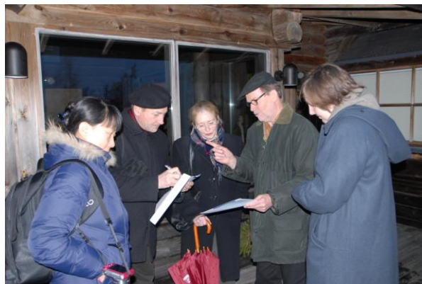
Fem länder i diskussion om världsarvskänndom.