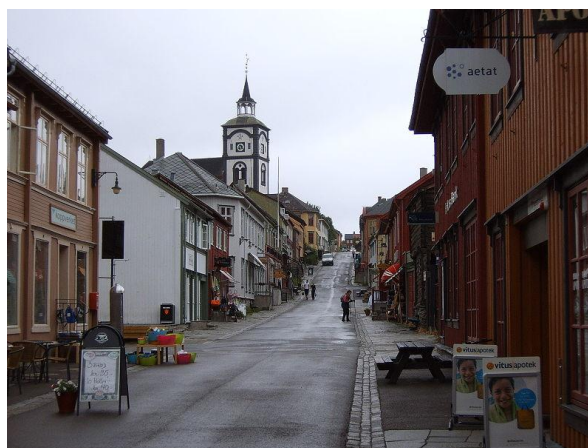
Bergsstadens Røros.

Inom ramen för världsarvskonventionens 40-årsjubileum kommer en internationell konferens att hållas 14-16.5 i UNESCO-världsarvet Røros, gruvstaden som har ett livfullt lokalsamhälle och är en av Norges sju världsarv. Konferensen Living with World Heritage , där bl.a. flera ministerier deltar i arrangemangen, behandlar världsarvet och hållbar utveckling, samt lokalsamhällets roll. Konferensen har en mellanregional fokus med betoning på Europa och Afrika. Målet är att skapa ett forum för dialog mellan globala, nationella och lokala aktörer, samt att öka samarbetet mellan experter, förvaltare och lokala representanter. Representanter från fem världsarv i Norge och Sydafrika kommer att träffas före konferensen för att diskutera gemensamma frågor relaterade till konferensens tema. Resultaten från de här dialogerna blir ett viktigt