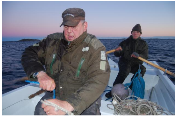
Strömmingsfiske på Aspö.