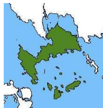
Mogenpört.