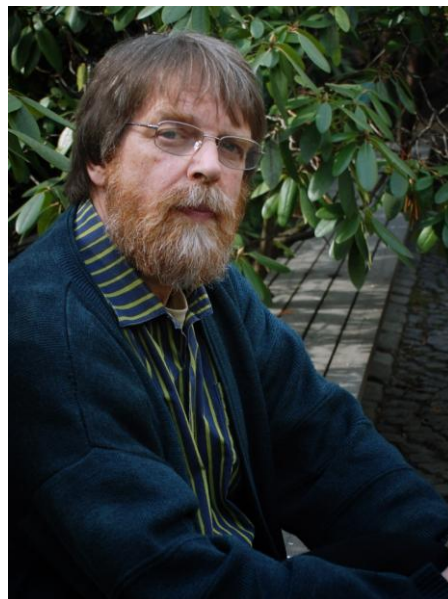
Arkivbild.

Den amerikanska efterkrigstidssociologins rebell, Charles Wright Mills, proklamerar i början av sitt viktigaste verk, The Sociological Imagination att samhällsvetaren bör fråga sig vilken strukturen är i det samhälle han/hon studerar, och hur delarna förhåller sig till helheten, hur det här samhället relaterar sig till historien och vilka förändringsmekanismerna är, samt vilken typ av människor som befolkar det här samhället. Jag tolkar det här som att ingenting i samhället är givet, och att det bör vara ett av grundpostulaten i den samhällsvetenskapliga forskningen. Desto märkligare är det att idéer hänger kvar också inom samhällsvetenskaplig diskussion och teori långt efter att den ”verklighet” som en gång gav upphov till dem för länge sedan är överspelad och passé. Mitt eget fält, landsbygdsstudierna, är ett flagrant exempel på det här. Längre har motsatsparet landsbygd-stad hållit landsbygds- (och för den del stads-)forskare i ett järngrepp, trots att insiktsfulla debattörer gång på gång framhållit det problematiska i den här tankefiguren. Den här debatten, och begreppsliga trögheten, illustrerar svårigheten att låta fantasin spela, på det som jag uppfattar att C Wright Mills anser att den bör göra inom samhällsvetenskap.